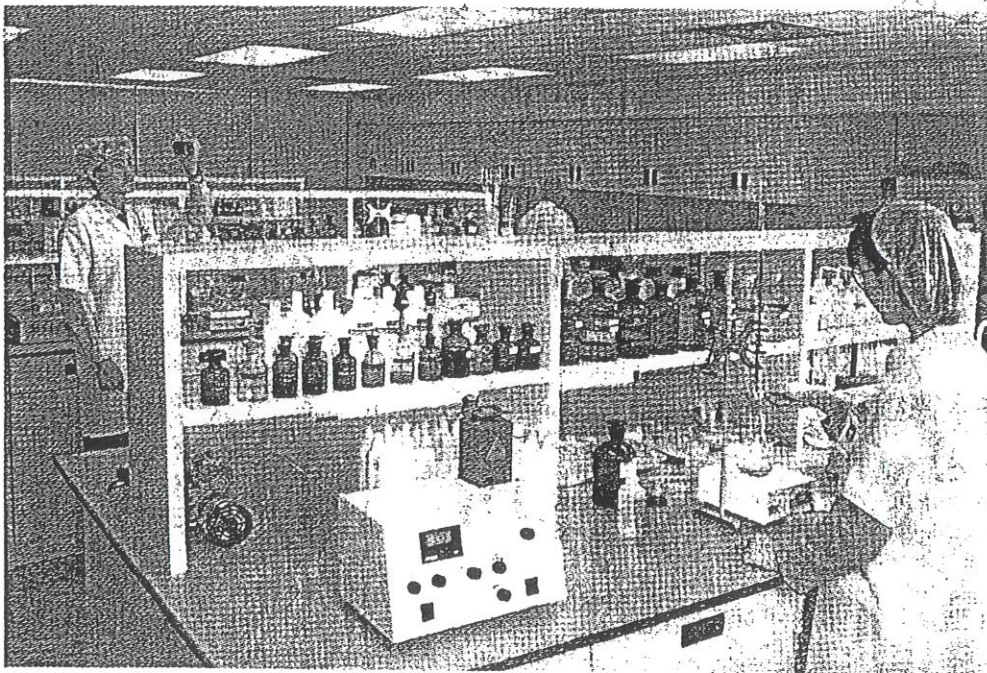
Opto-Pharm公司的研究员, 在现代化实验室进行产品的品质控制分析。

他表示, 假如没有买主, 他计划在未来三年内为公司申请上市, 到时, 他将以不同的方式经营这间公司。他也预测, 该公司在未来三年内, 营业额将达到1000万元, 到时每年将会有300至400万元的盈利。